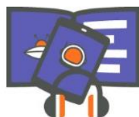
Jeugdbibliotheek 6-9 jaar