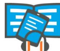
Jeugdbibliotheek 12-15 jaar

De boeken die je vindt zijn eenvoudig bij jouw eigen bibliotheek te reserveren via de bibliotheekapp . Staat het boek voor je klaar? Ophalen maar! En dan lekker lezen!