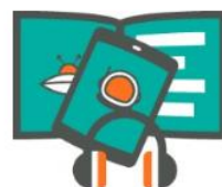
Jeugdbibliotheek 9-12 jaar