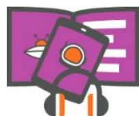
Jeugdbibliotheek 0-6 jaar

Via www.jeugdbibliotheek.nl vind je heel gemakkelijk boeken over een bepaald onderwerp. Of over populaire series, zoals de Effies of Julius Zebra . Je kunt eenvoudig zoeken op leeftijd. Er gaat een wereld voor je open.